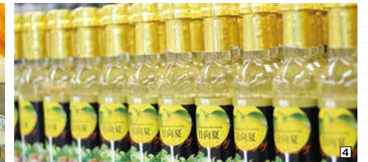
1.宮崎県の伝統工芸士を含め、職人がハマグリ碁石を丹精込めて作っています。 2.世界オンリーワンで、最高級品である「ハマグリ碁石」の伝統をこれからも守り続けていきます。 3.日向夏ドレッシングやほん酢など1本1本私たちが真心込めて作っています。 4.自社工場で作った日向夏ドレッシングは、全国の百貨店・小売店で多く販売されています。